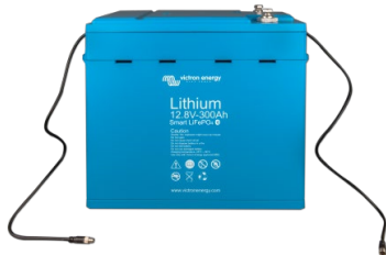
12,8V 300Ah LiFePO4 Batterie

Dies ist sehr nützlich, um ein (mögliches) Problem wie ein Zellenungleichgewicht zu erkennen.