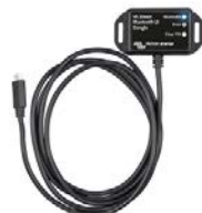
VE.Direct Bluetooth Smart Dongle (separat zu bestellen)

Eine zu hohe oder zu schwache Batteriespannung wird durch einen akustischen und einen visuellen Alarm sowie durch ein Relais für eine Fernanzeige signalisiert.